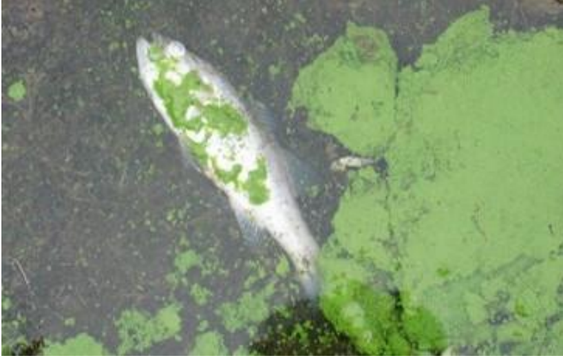
تكاثر الطحالب يمكن أن يتسبب في إلحاق الأذى بالحيوانات البرية.