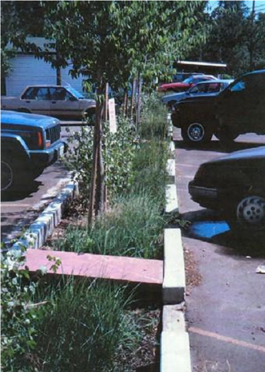
الحل المتمثل في الحدائق المطيرة والمتعلق بالجريان السطحي لساحة انتظار السيارات.